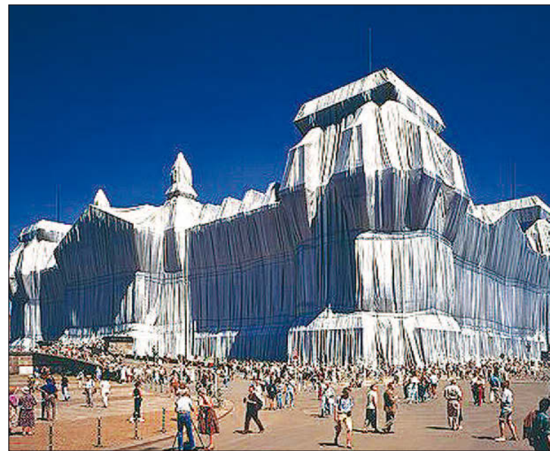
Zentrum der Macht: der einst von Christo verpackte Reichstag.