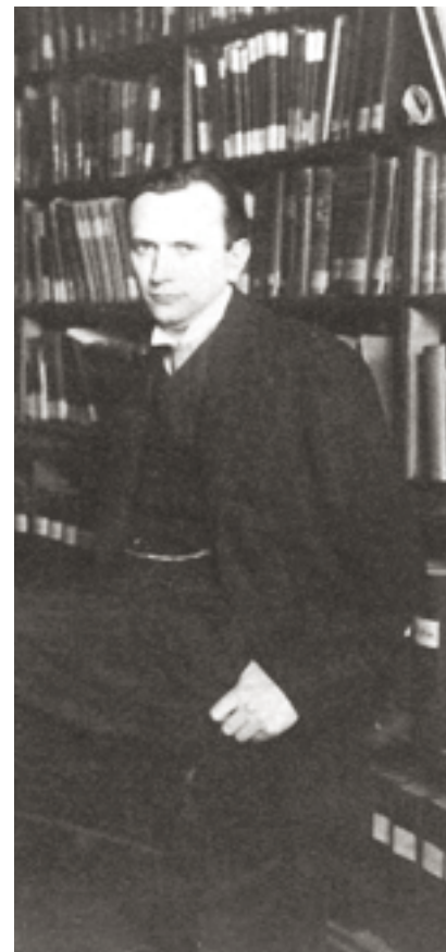
Der junge Karl Jaspers in der Heidelberger Bibliothek, um 1912.