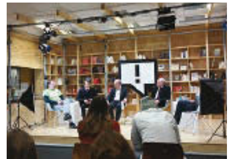
Correctiv-Diskussion im Hostel.

Mittendrin im Auge des Gemeindepsychiatrischen Zyklons habe ich mich immer der Psychiatrie zugehörig gefühlt. Für sie schlug mein Herz. Dass ich als Sozialarbeiterin im Gesundheitsamt gleichzeitig Teil des ÖGD, des Öffentlichen Gesundheitsdienstes, war, habe ich immer verdrängt. Der Kampf gegen Legionellen und Kopfläuse war mir immer fremd geblieben. In diesem Jahr war ich mit einem kleinen Beitrag zur Situation der Wohnungslosen beteiligt am großen, jährlichen ÖGD-Kongress, der sich mit den