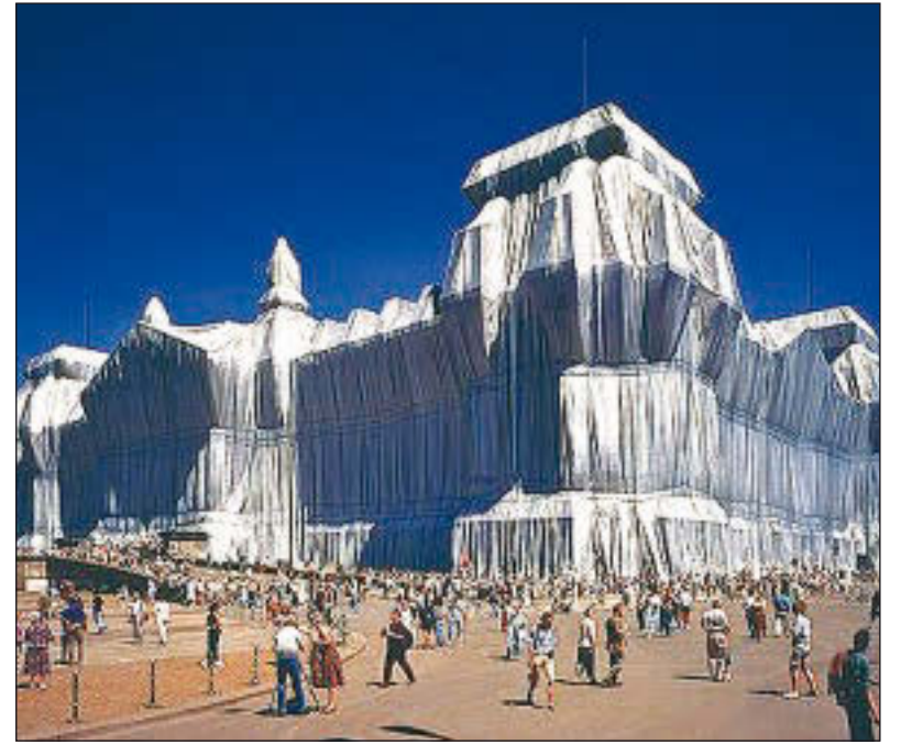
Zentrum der Macht: der einst von Christo verpackte Reichstag.