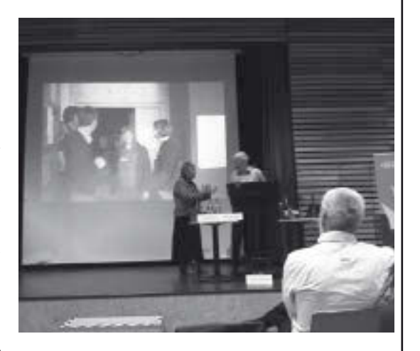
"Segel setzen" – Blick aufs Podium.

rang. Wie schon bei der letzten Tagung wird auch heute aus Bayern von einem Hund berichtet, der zum entscheidenden Eingliederungshelfer für einen Klienten mit einer schweren Angststörung wurde. Inzwischen gibt es neue Ideen: die Finanzierung des Besuchs einer Hundeschule im Rahmen des Persönlichen Budgets, die Eroberung brachliegender Laubengrundstücke für gärtnernde Klienten. Es gibt Sozialarbeiterinnen, die eröffnen jede Dienstbesprechung mit dem TOP: Neues im Sozialraum. Tipps und Flyer werden gesammelt in Ordnern und Datenbanken. Sozialräumliches Denken ist Mainstream, vor allem in der Provinz, denn dort wird aus dem Mangel erst recht