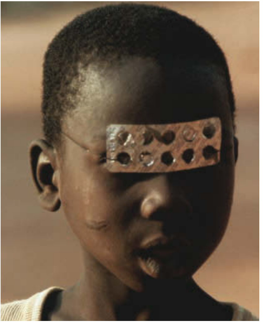
Eine fotografische Berühmtheit: Ein junger Afrikaner am Königshof von Abomey, der eine leere Medikamentenhülse als Augenmaske benutzt, durch die er anscheinend nicht hindurchblicken kann.

verweildauerabhängige degressive Vergütung: Je länger ein Patient im Krankenhaus behandelt wird, desto weniger steht dem Leistungsträger für die Behandlung des Patienten pro Tag zur Verfügung – unabhängig von Krankheit und Heilungsverlauf. Auch die Deutsche Gesellschaft für Psychiatrie, Psychotherapie, Nervenheilkunde und Psychosomatik (DGPPN) ruft daher zur Unterzeichnung der Petition gegen den Abrechnungskatalog auf, der vom damaligen FDP-Gesundheitsminister per Ersatzvornahme in Kraft gesetzt wurde. Die DGPPN verweist auch auf eine Machbarkeitsstudie, in der Alternativen zum PEPP aufgezeigt werden. Und sie verlinkt direkt auf die Petition, für die man sich registrieren lassen muss. Zu finden ist sie auf der Homepage https://epetitionen.bundestag.de unter der Nummer "46537" und unter dem Titel "Vergütung für medizinische Leis-